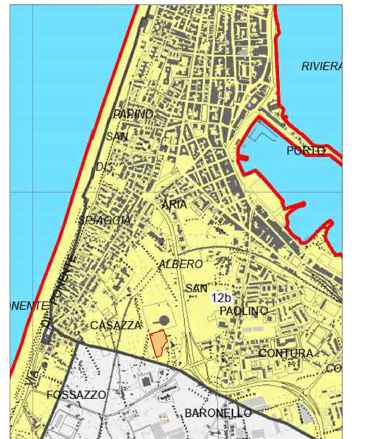
stralcio PIANO PAESISTICO - regimi normativi scala 1:10.000