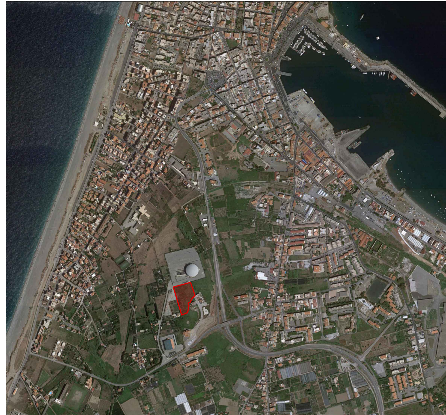
ORTOFOTO scala 1:10.000