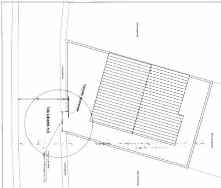
Planimetria scala 1:100