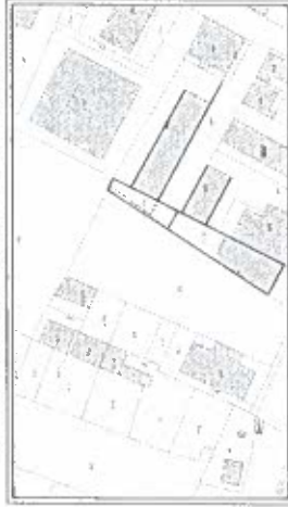
STRALCIO CATASTALE - SCALA 1:1000

- FOGLIO N.5/A - PARCELLA N.1770 (in parte)