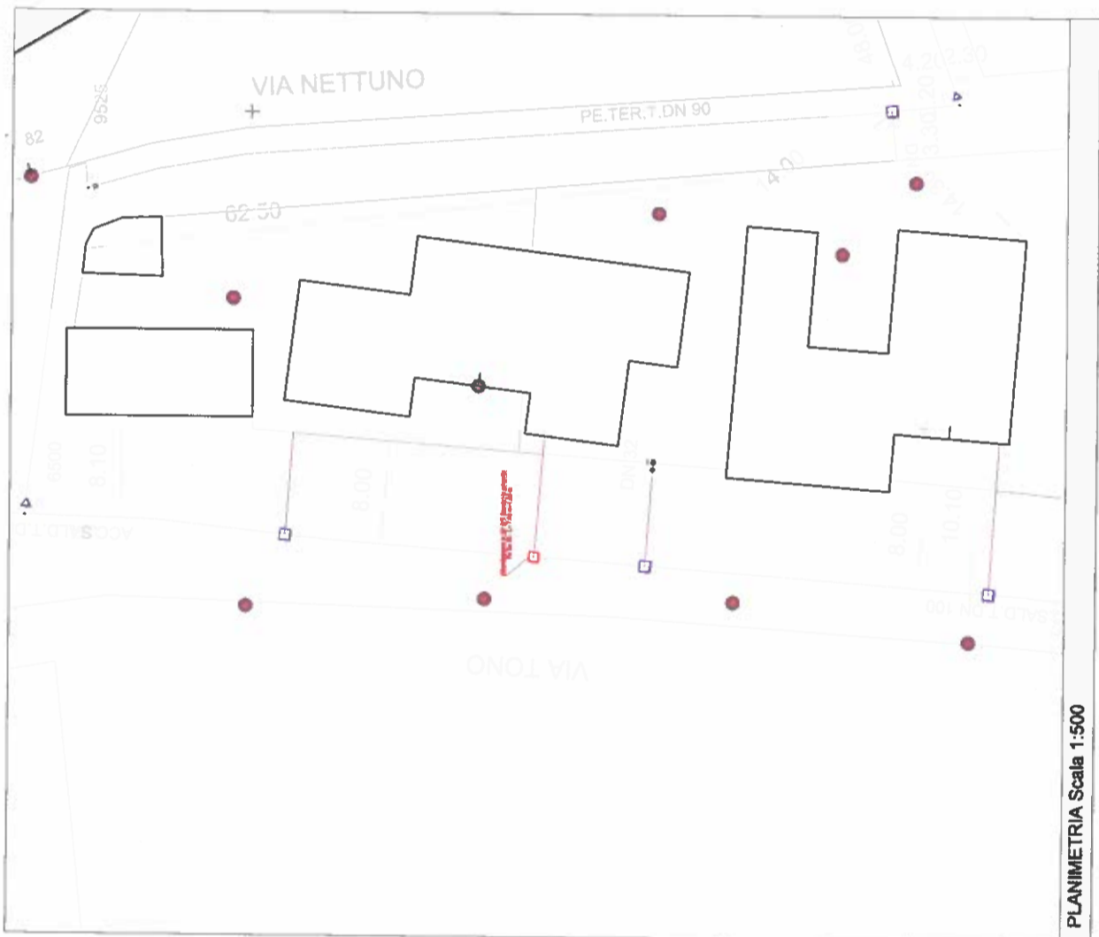
PLANIMETRIA Scala 1:500