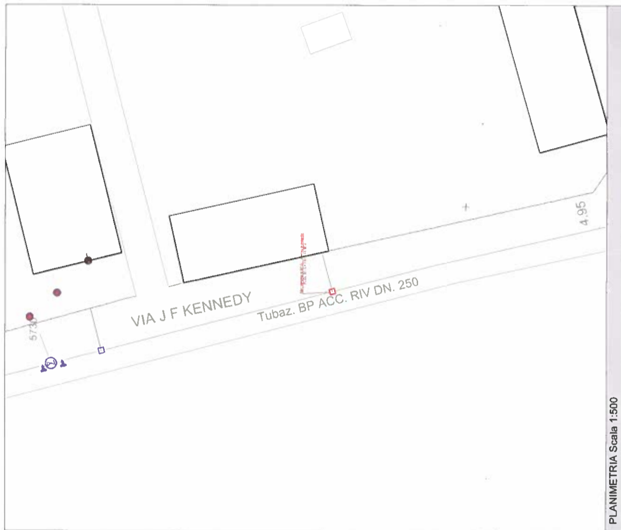
PLANIMETRIA Scala 1:500