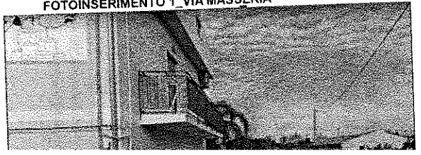
FOTOINSERIMENTO 1 VIA MASSERIA