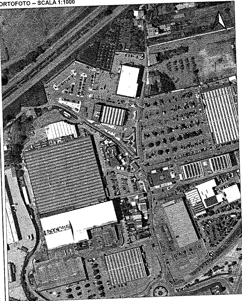
ORTOFOTO -- SCALA 1:1000