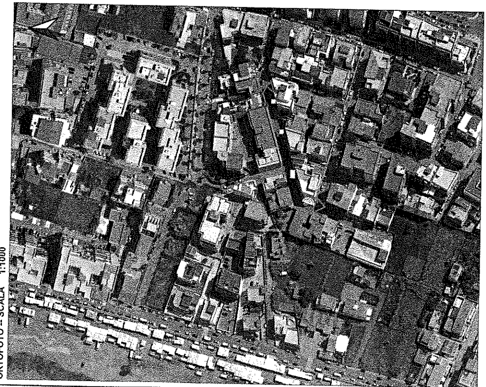
FOTOINSERIMENTO 1_VIA VIA PARATORE