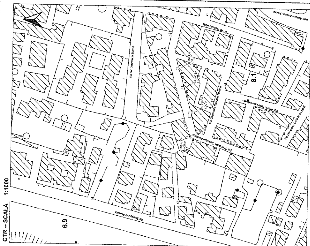
FOTOINSERIMENTO 2_VIA PARATORE

> CONTO VISIVO INFRASTRUTTURA PROGETTATA INFRASTRUTTURA ADOTTATA CLP CASERTA PONO - CASERTA TIR SCAVO IN NODI TERMINAZIONE INTERFERA IN MANIFESTAZIONE ELEMENTI OTICI ARABICO (R) NUOVO POZZETTO 47M7 NUOVO POZZETTO 487V9 NUOVO POZZETTO 487V8 NUOVO POZZETTO 130846 NUOVO POZZETTO 132888 NUOVO POZZETTO INTERVALLO 123546