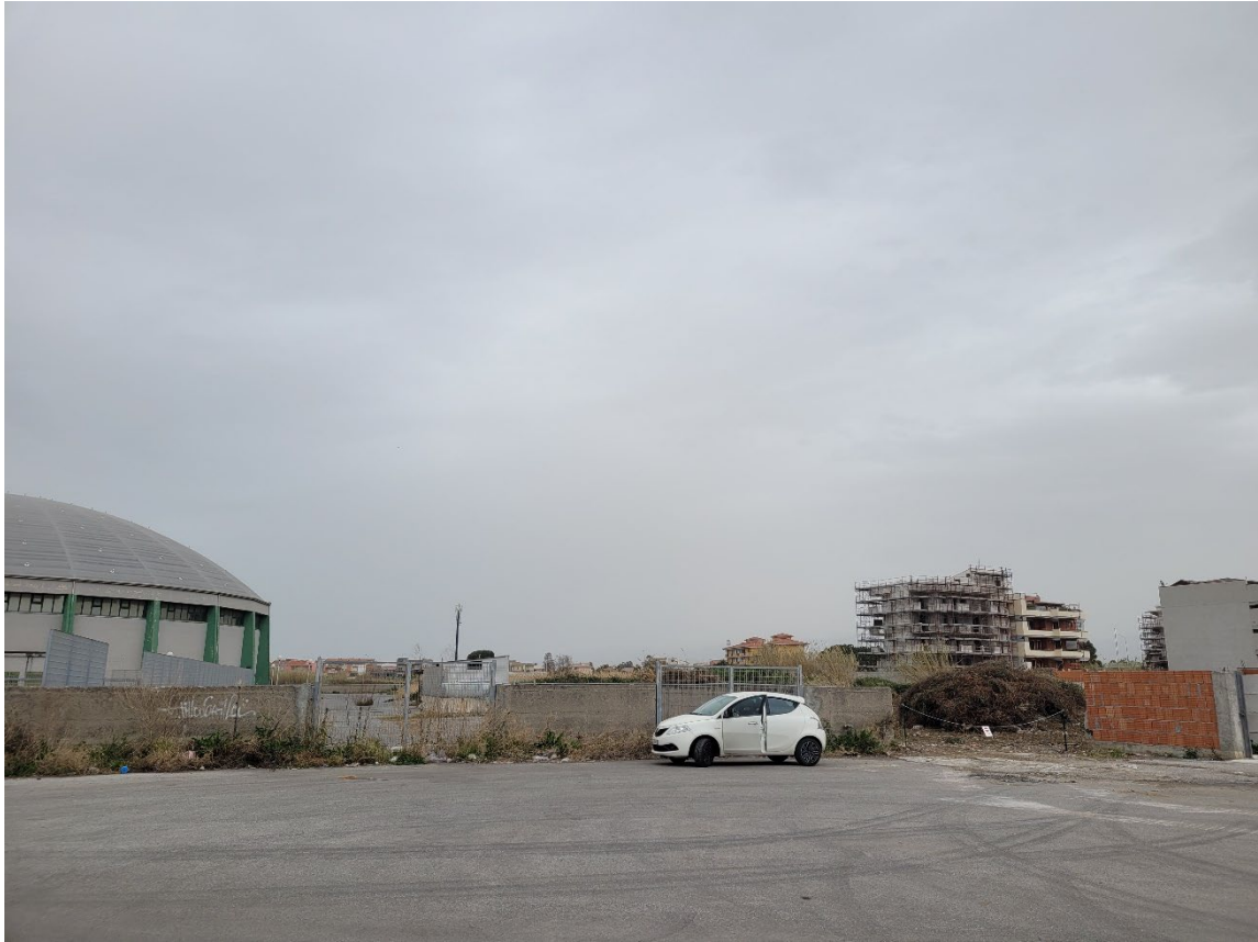
F01_Vista dello spiazzale antistante l'area