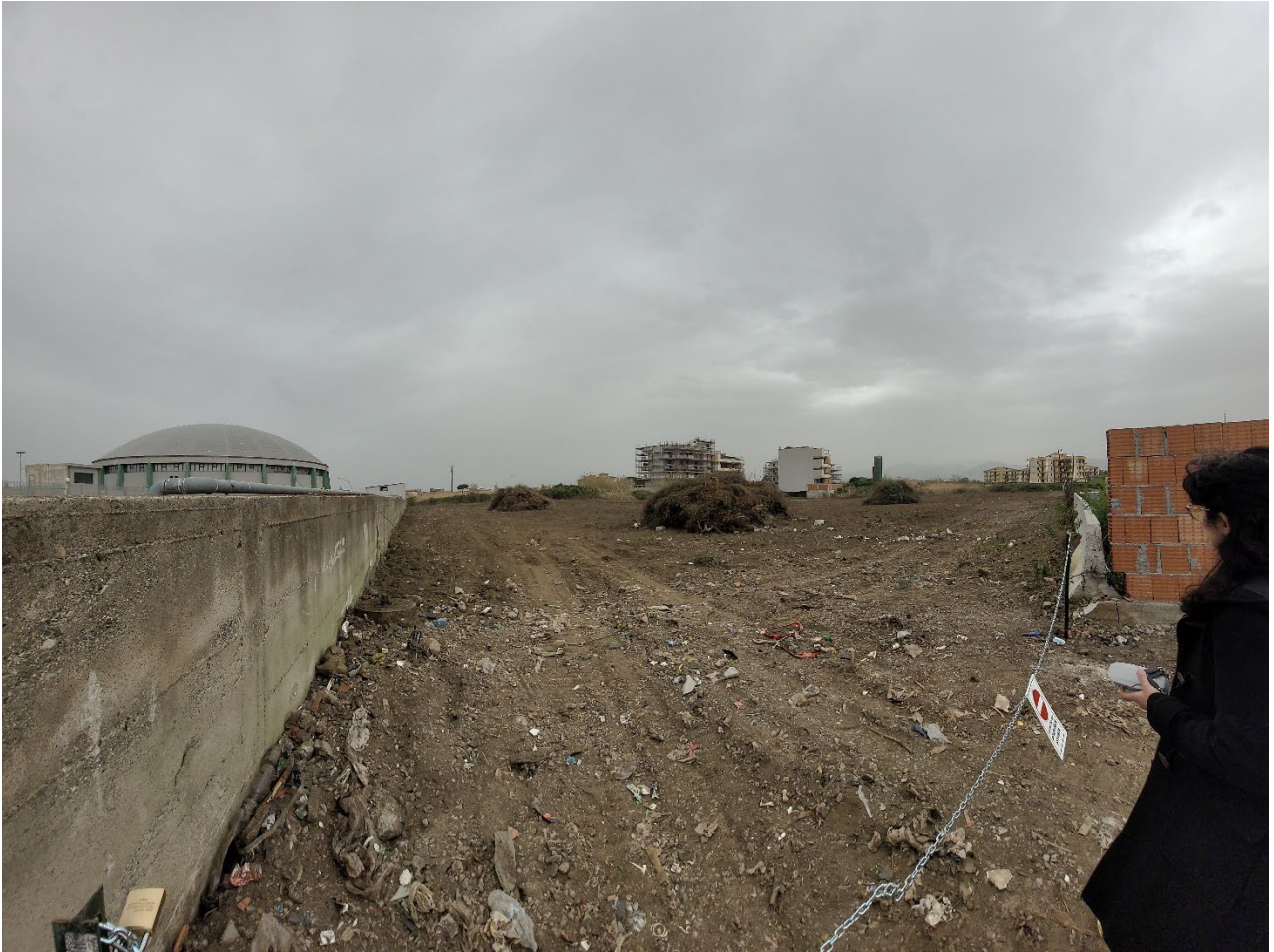
F03_Vista dall'accesso all'area; sulla sinistra il muro in c.a. a confine con l'adiacente Palazzetto dello sport