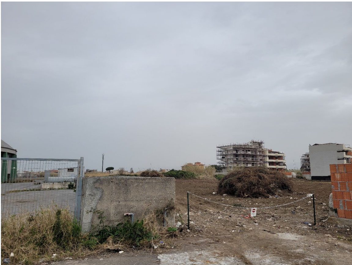
F02_Vista dell'accesso all'area